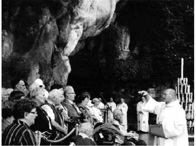
Gelegenheidskoor van de Limburgse Bedevaart eerste week september 2009

Terwijl ik in Lourdes mensen aanmoedig om de Internationale Mis op woensdag of zondag zeker niet te missen! Daar zijn volk, priesters, koor en organist weliswaar zoals het hoort van elkaar onderscheiden, maar toch en absoluut één in het vierende en zingende Godsvolk.